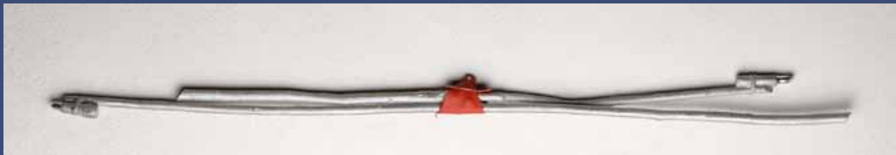
FLECHES, 2014 Aluminium, cuir 7 x 118 cm