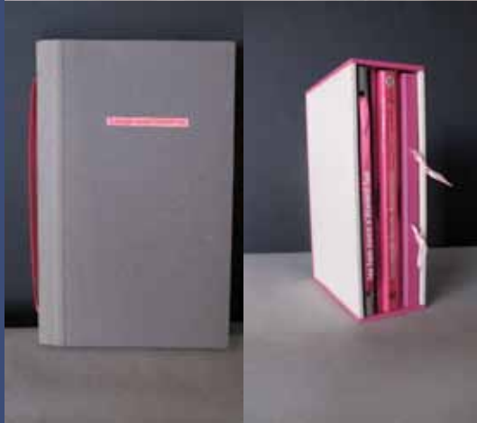
LES TAM-TAMS S'ETAIENT TUS, 2014 Livre découpé, recueil de poèmes, coffret 18,5 x 11,5 x 5,5 cm