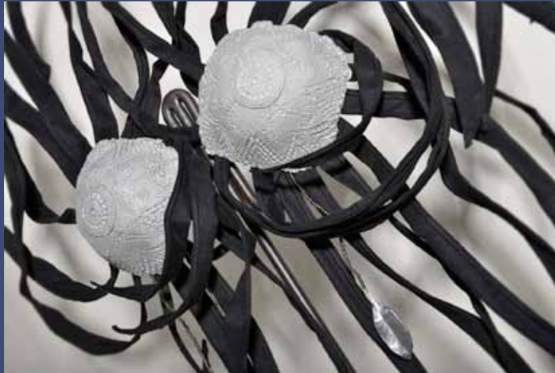
APHRODISIA PENTHESILEA, 2014 Aluminium, tissu, perles, fer 210 x 90 x 50 cm base 33 x 33 cm