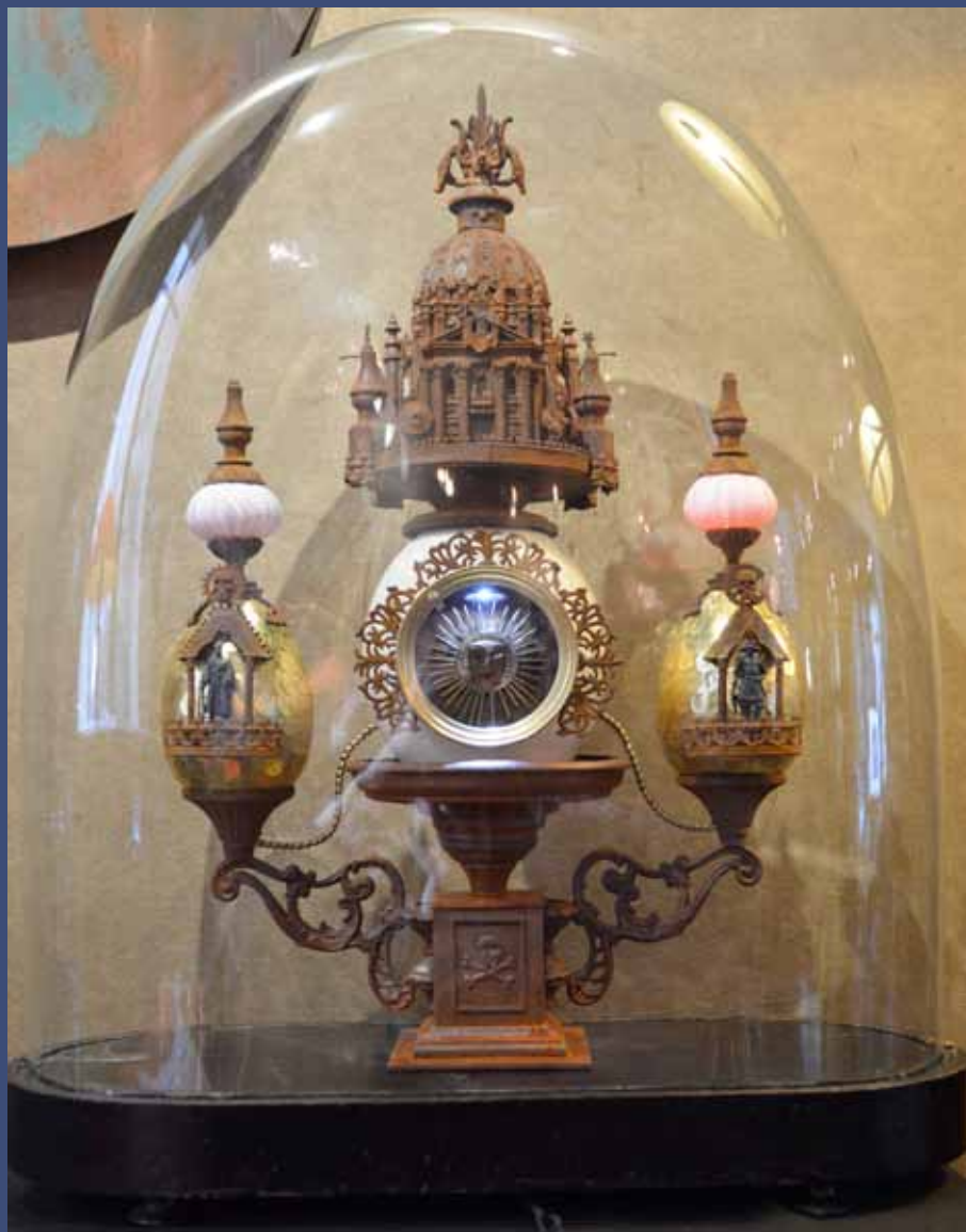
LUPUTA, 2014 Technique mixte,  clairage led, globe en verre 54 x 21 x 44 cm