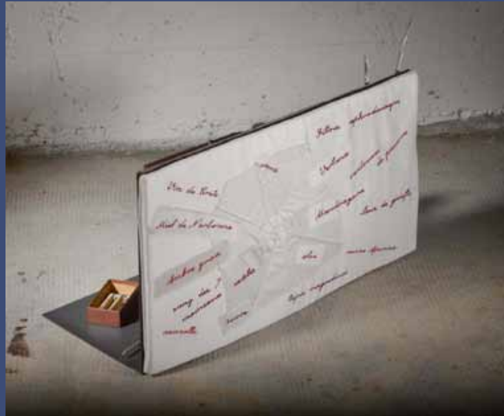
BOÎTE APHRODISIAQUE, 2014 Objets trouvés, miroir, aluminium, tissu brodé 33 x 53 x 23.5 cm