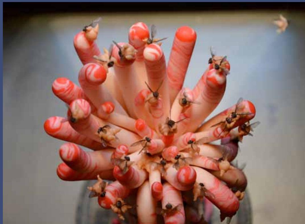
PETITE OASIS (2 pièces), 2014 Pâte fimo, corps de mouche, globe en verre h. 11 x 9 cm diam.