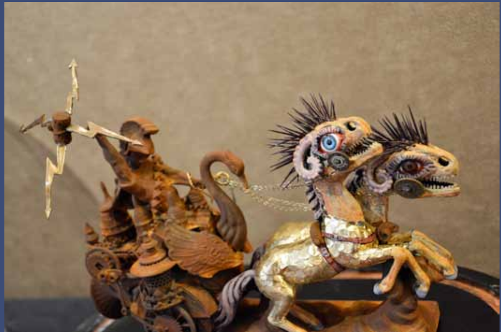
THUNDERBOLTS OF THE GODS, 2014 Technique mixte, globe en verre 41 x 20 x 33 cm