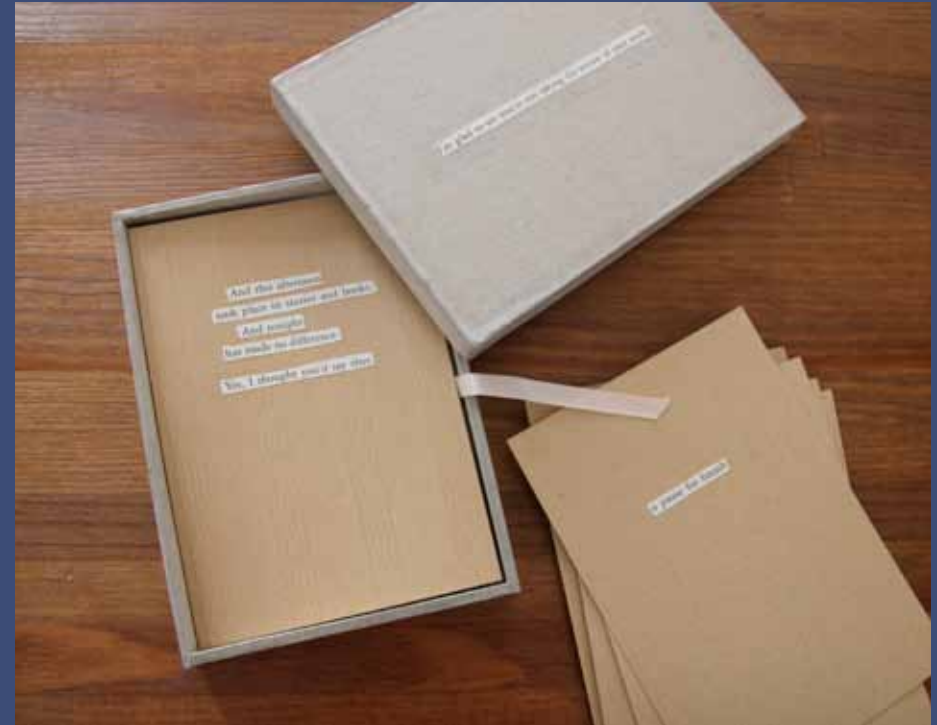
I'M GLAD YOU'RE NOT TAKING THE EXCUSE OF YOUR WORK, 2013 poèmes sur 13 feuilles kraft, coffret 11,5 x 16,5 x 1,5 cm