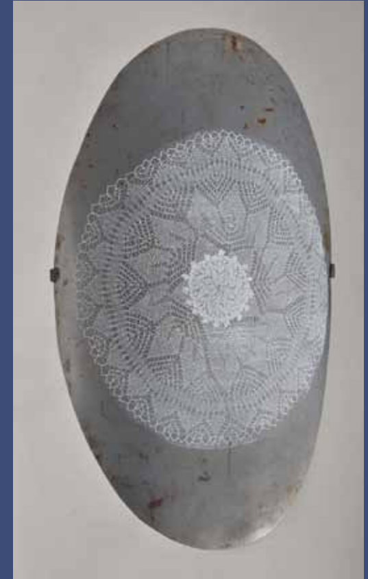
BOUCLIER 3, 2013 Aluminium 90 x 19 x 14,5 cm