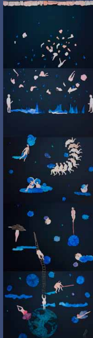
BLUE DREAM, 2014 Aquarelle sur papier découpé installation de 5 dessins chaque 51 x 71cm installation 255 x 71 cm