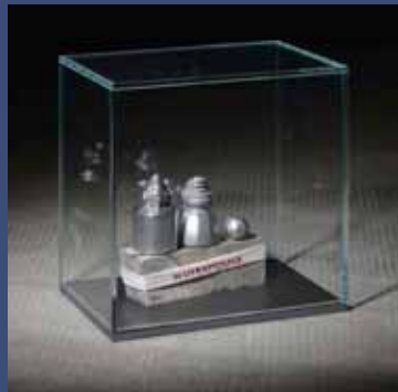
MUIRAPUAMA, CATUABA, MACA, 2014 Aluminium, tissu brodé, bois, fer, vitrine 27,5 x 26 x 18 cm