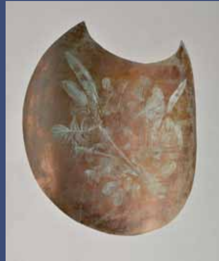
PELTA 1, 2014 Cuivre 19 x 18 x 11 cm