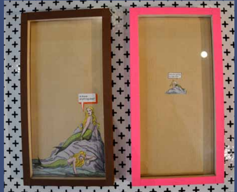
MINI-RECITS, 2013-2014 collages sur kraft 12,2 x 23,2 cm