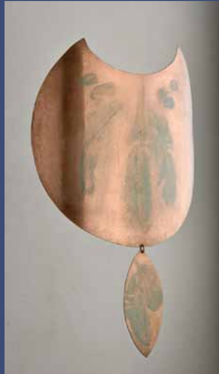
PELTA 2 avec son pendentif, 2014 Cuivre 27 x 18 x 13 cm