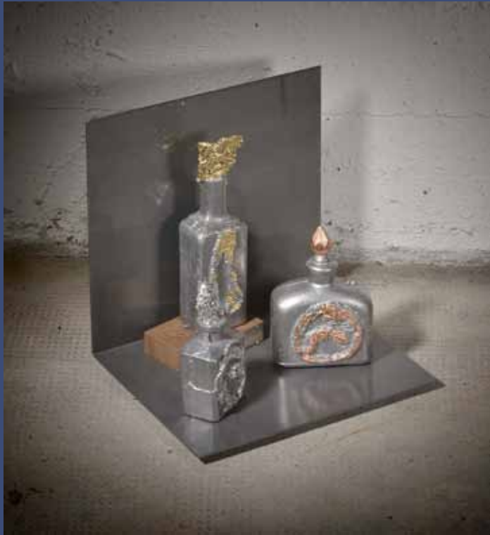
POTIONS MAGIQUES, 2014 Aluminium, feuilles cuivre, or et argent, fer 30 x 27 x 22 cm