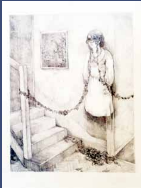
VISION, 2012 Graphite sur papier 48,5 x 39,5 cm.