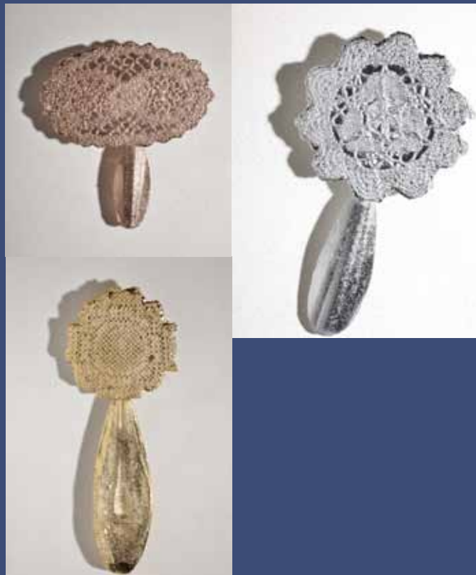
AMULETTES (série de 3), 2014 Aluminium plaqué or - cuivre et un chromé mesures variables