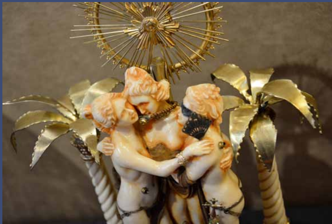
CHASTITY GIRLS, 2014 Technique mixte, globe en verre 38 x 19 x 27 cm