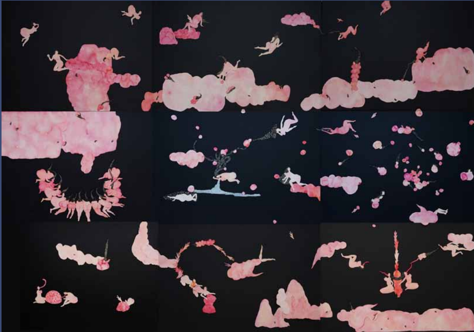
ROSE MADNESS, 2014 Aquarelle sur papier découpé installation de 9 dessins chaque 51 x 71 cm installation 153 x 243 cm