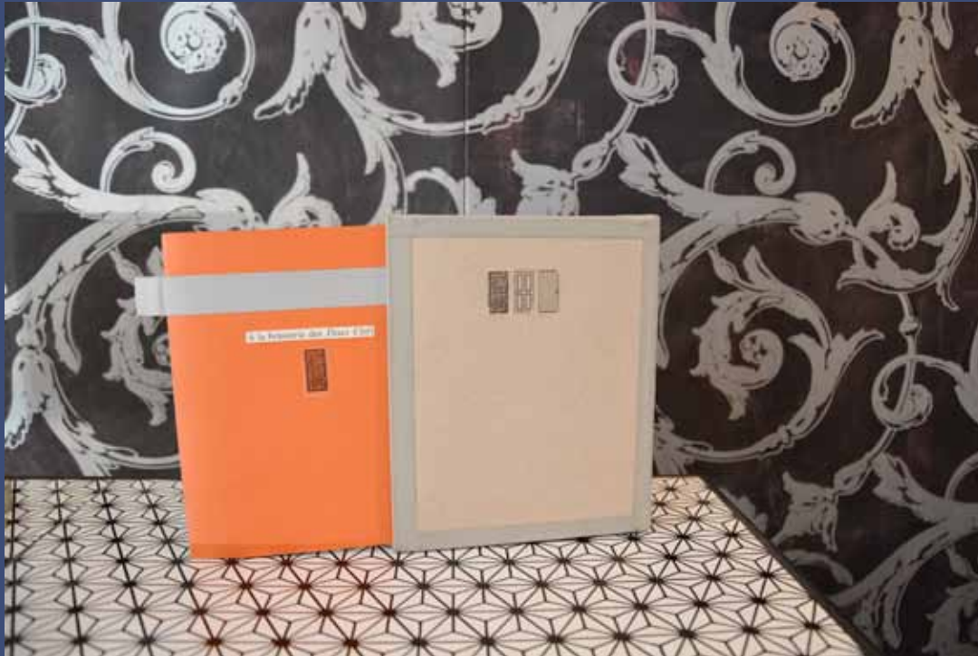
TROIS PORTES, 2013 trois recueils de poèmes, coffret 14,5 x 17,5 x 3 cm