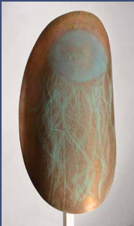
BOUCLIER APHRODISIA 2, 2013 Cuivre avec couleur 90 x 19 x 14,5 cm