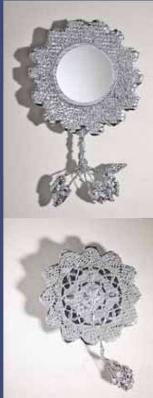
AMULETTES (série de 2), 2014 Aluminium chromé, Miroir mesures variables