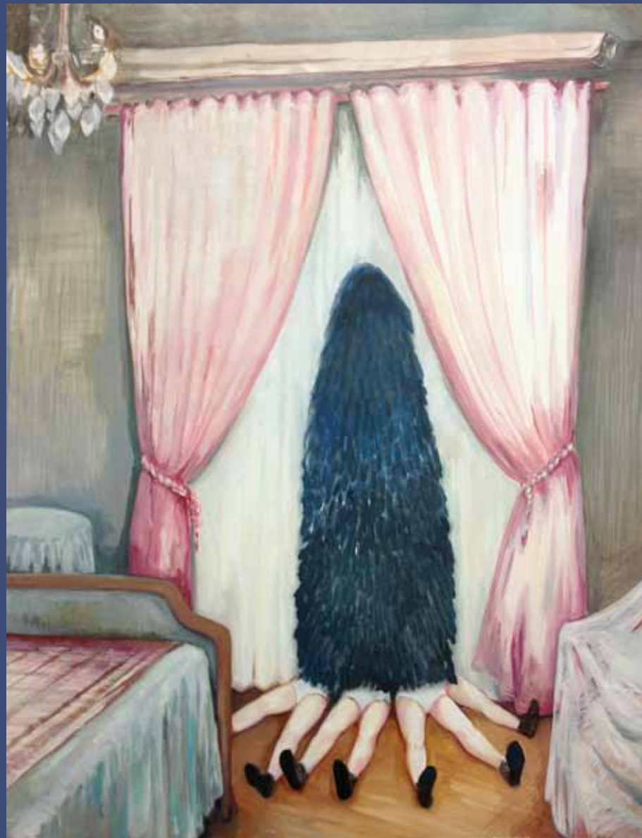
CHRISTMAS TREE MAYBE, 2012 Huile sur toile 145 x 115 cm