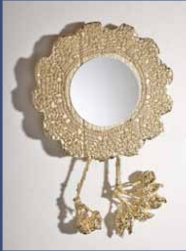
AMULETTE , 2014 Aluminium plaqué Or, miroir 37 x 22 cm