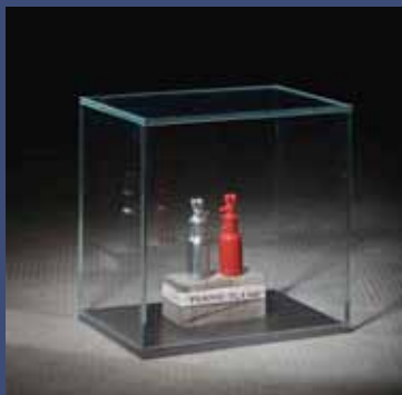
YLANG -YLANG, 2014 Aluminium, tissu brodé, bois, fer, vitrine 27,5 x 26 x 18 cm