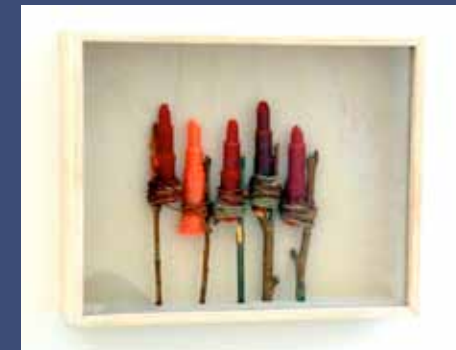
POINTES DE LANCE, 2012 Cire colorée, bois, ficelle 26 x 35 x 9 cm