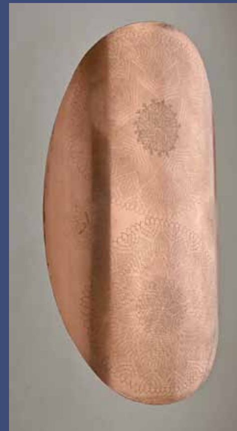
BOUCLIER 2, 2013 Cuivre 90 x 19 x 14,5 cm