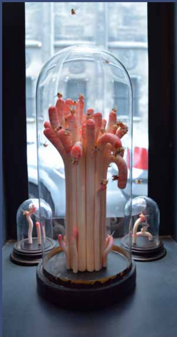
L'OASIS, 2014 Pâte fimo, corps de mouche, globe en verre h. 33 x 13 cm diam.