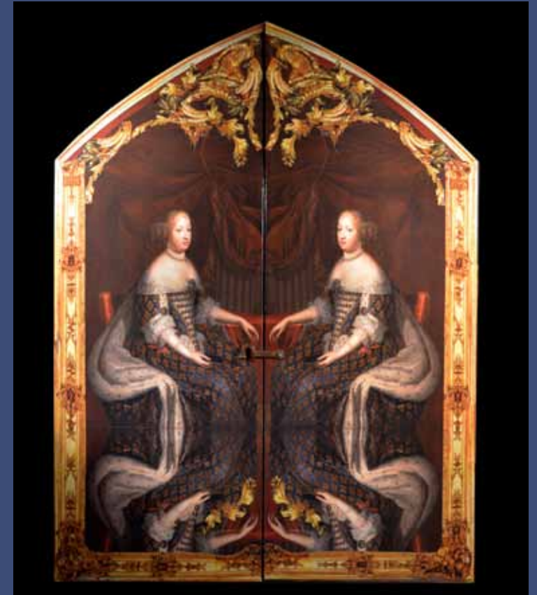
LE RETABLE DE LA REINE MARIE-THERESE, 2014 Collage sur panneaux de bois 120 x 80cm ouvert 60 x 80 cm ferm 