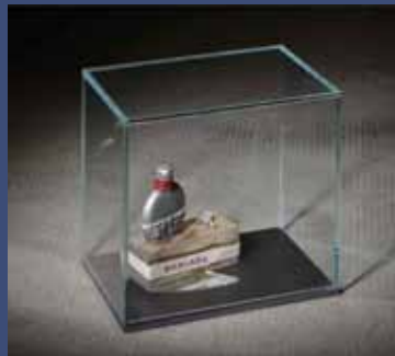
DAMIANA, 2014 Aluminium, tissu brodé, miroir, bois, fer, vitrine 27,5 x 26 x 18 cm