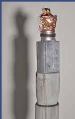
SCEPTRE, 2014 Aluminium, feuille cuivre, perles, bois, fer 137 x 6 x 7 cm base 22 x 22cm