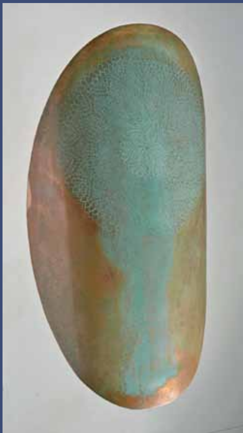
BOUCLIER APHRODISIA 1, 2013 Cuivre avec couleur 90 x 19 x 14,5 cm