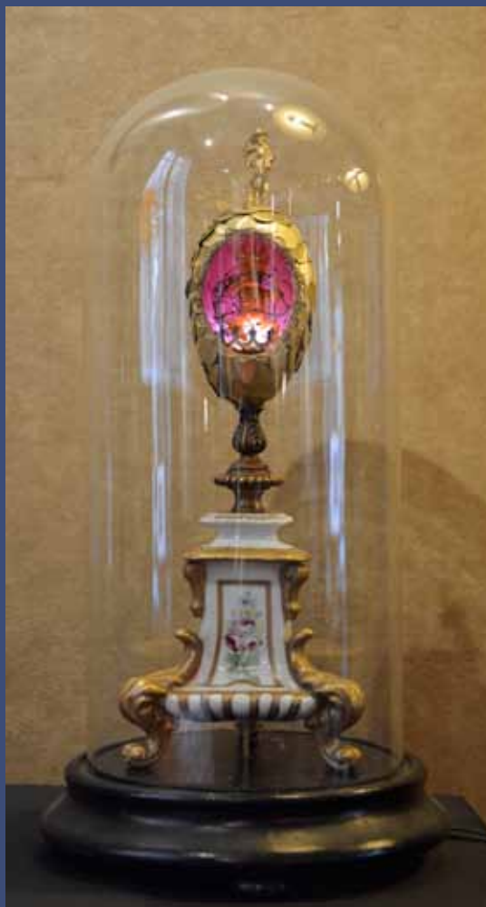
SORCIER, 2014 Technique mixte, éclairage led, globe en verre 29 x 20 x 13 cm