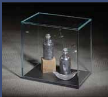
ALCOOL, 2014 Aluminium, fil rouge, perles, bois, fer, vitrine 27,5 x 26 x 18 cm