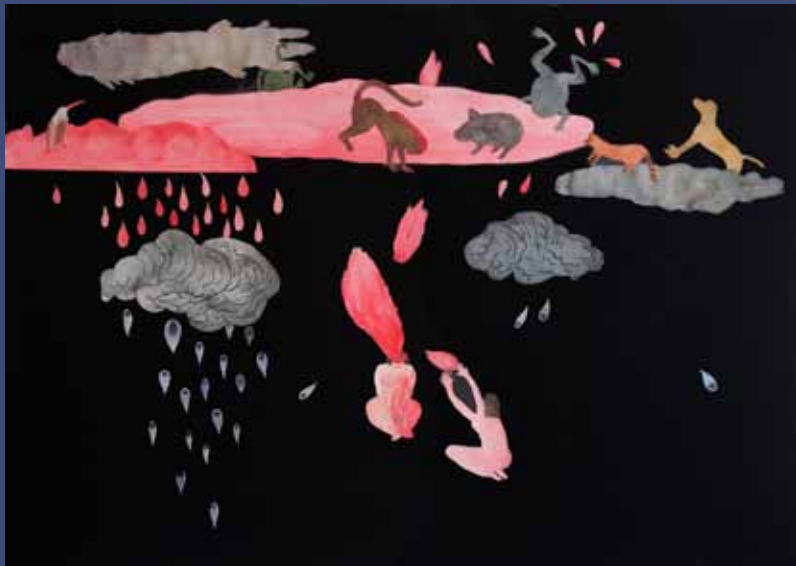
GIFT WITH CHAMAN, 2014 Aquarelle sur papier découpé 51 x 71cm