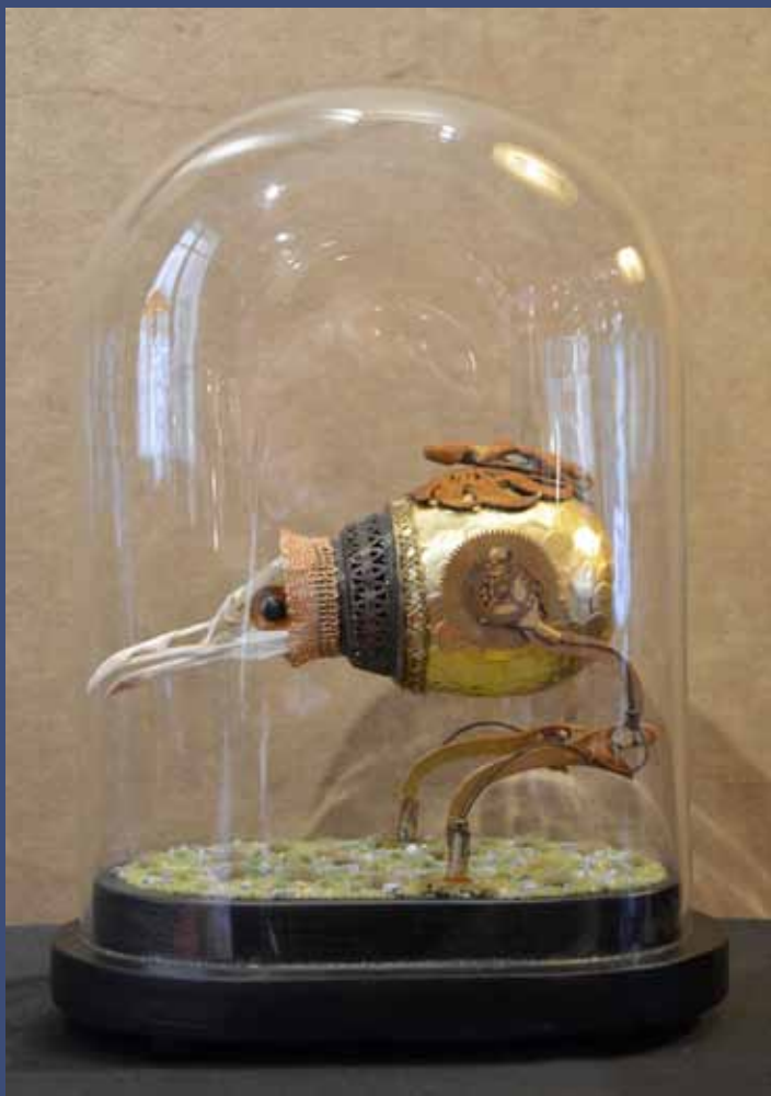
CRAZY COCK, 2014 Technique mixte, globe en verre 29 x 20 x 13 cm