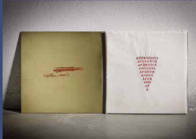
MOT MAGIQUE, 2014 Transfert photographique sur laiton, tissu brodé, fer 27 x 55 cm