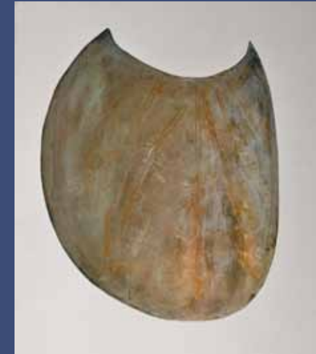
PELTA 2, 2014 Cuivre 19 x 18 x 11 cm