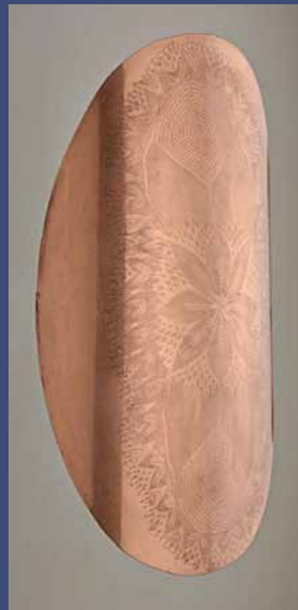
BOUCLIER 1, 2013 Cuivre 90 x 19 x 14,5 cm