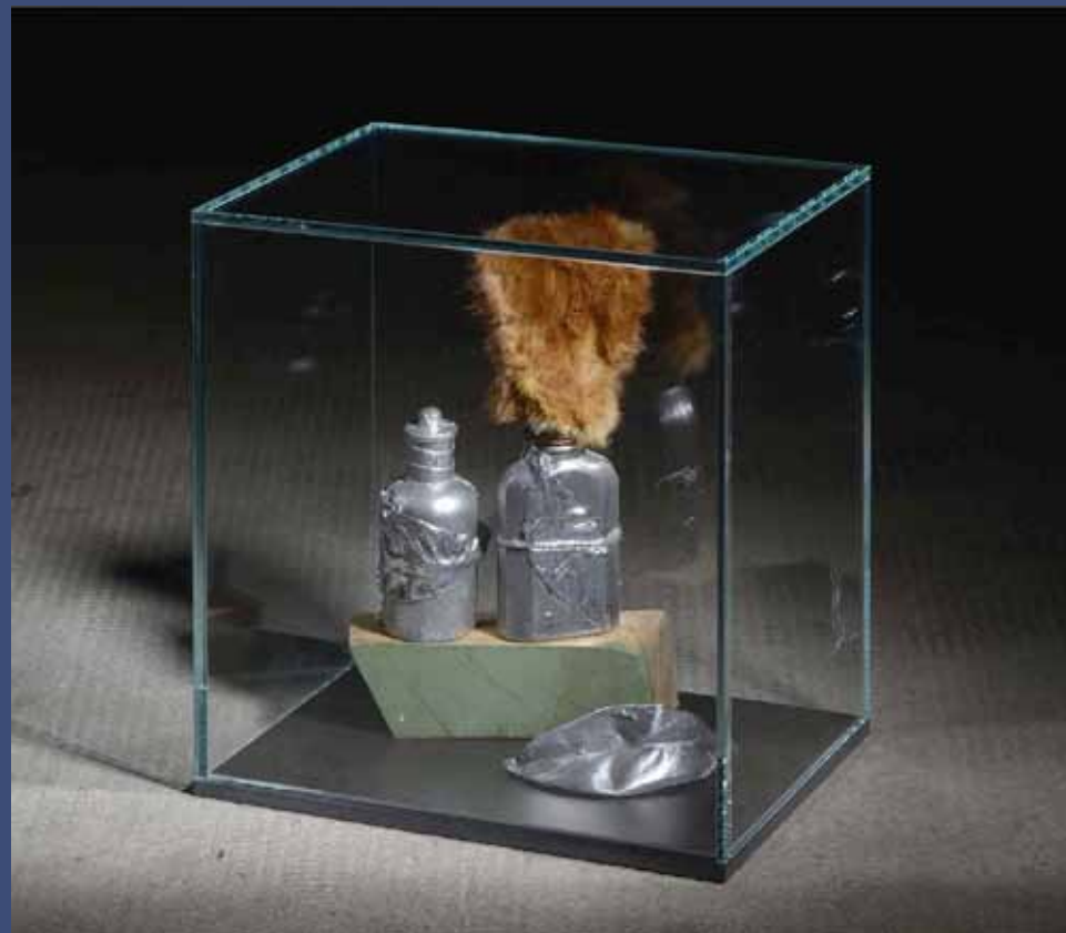
VERBENA, 2014 Aluminium, fourrure, perles, bois, fer, vitrine 31 x 28 x 20 cm