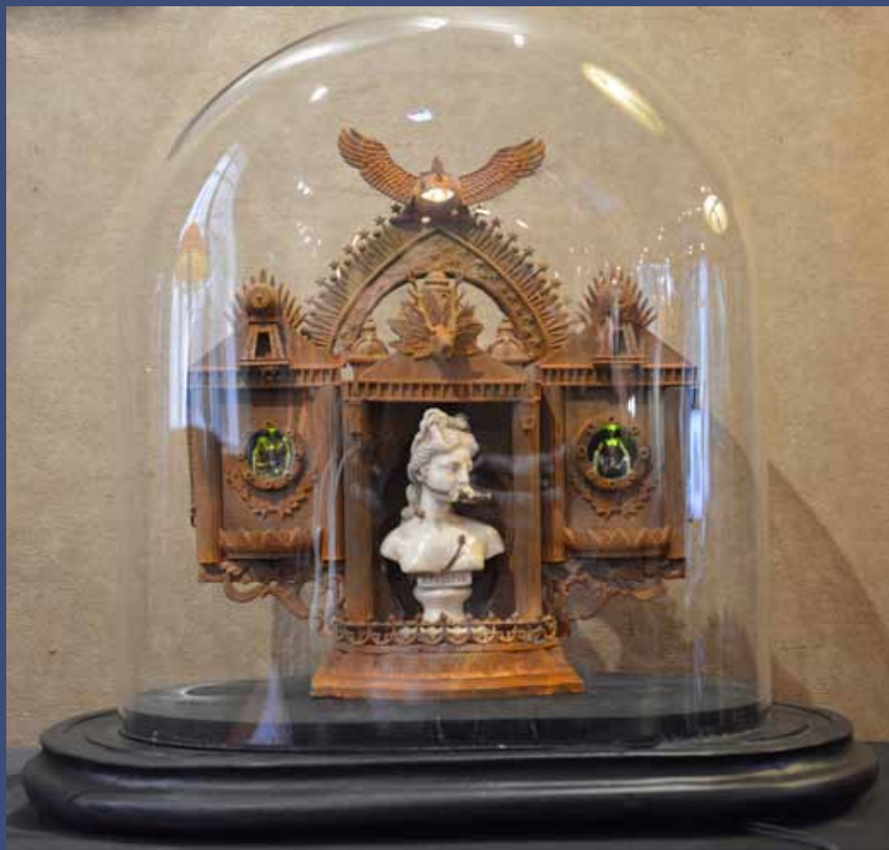
APHRODITE, 2014 Technique mixte,  clairage led, globe en verre 38 x 21 x 40 cm