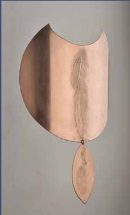
PELTA 1 avec son pendentif, 2014 Cuivre 27 x 18 x 13 cm