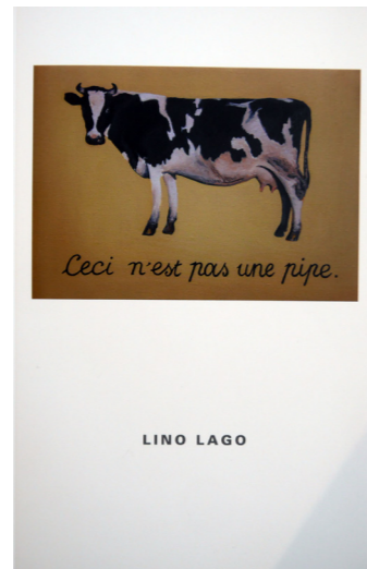
Esto no es una pipa , MAC Coruna, Spain 2016