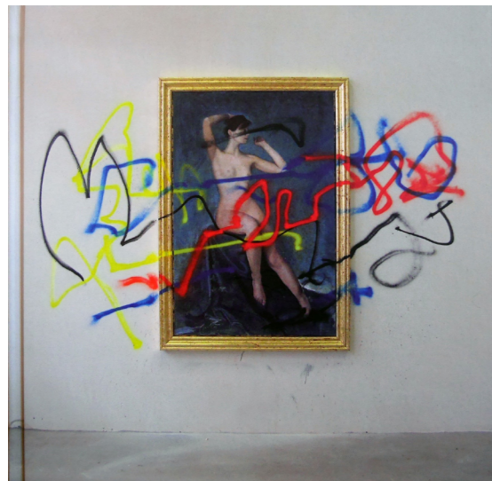
Lino Lago , Deputacion Ourense, Spain 2010