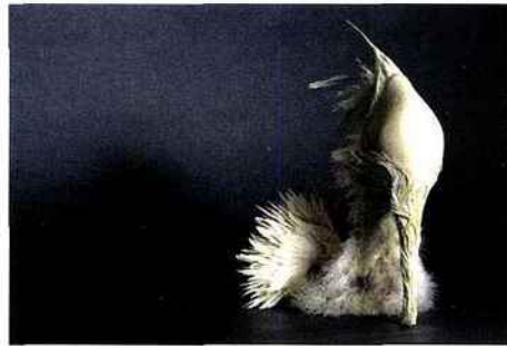
LAURENCE LE CONSTANT, ÈVE, 2015, PLUMES D'OIE ET DE CANARD SUR SOULIER MASSARO. © LAURENCE LE CONSTANT COURTESY GALERIE GERALDINE BANIER