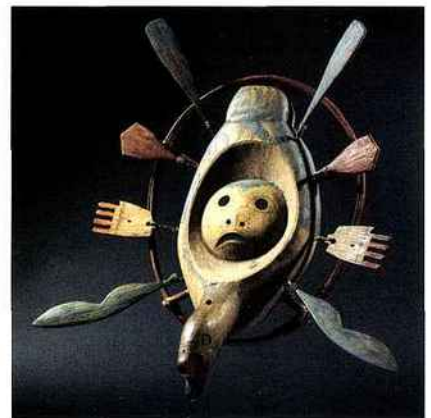
MASQUE COMPLEXE YUPIK ESKIMO, ALASKA, VERS 1880, ANCIENNE COLLECTION WILLIS CAREY HISTORICAL MUSEUM, CASHMERE, WASHINGTON, USA.