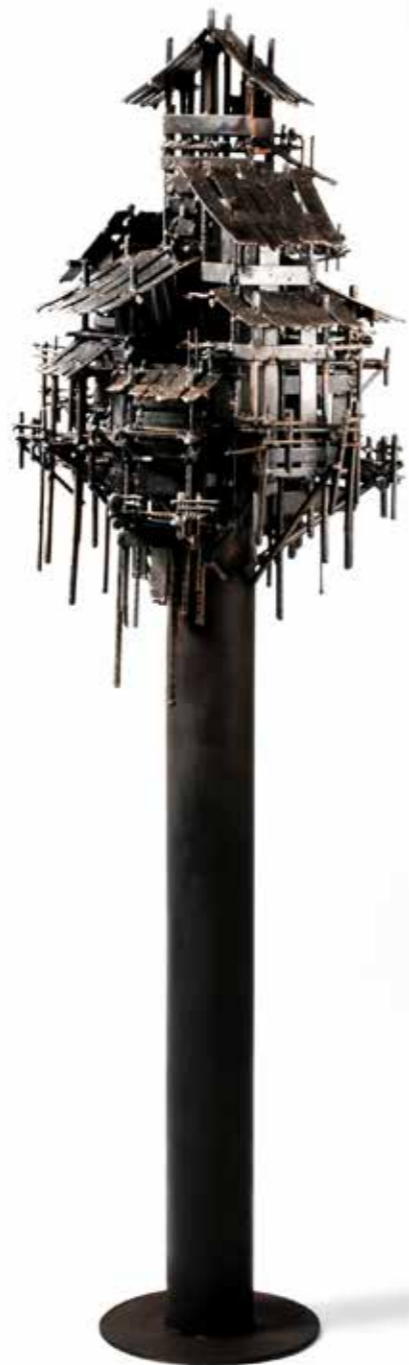
Aldeas transversales Unique Piece Corten Steel.