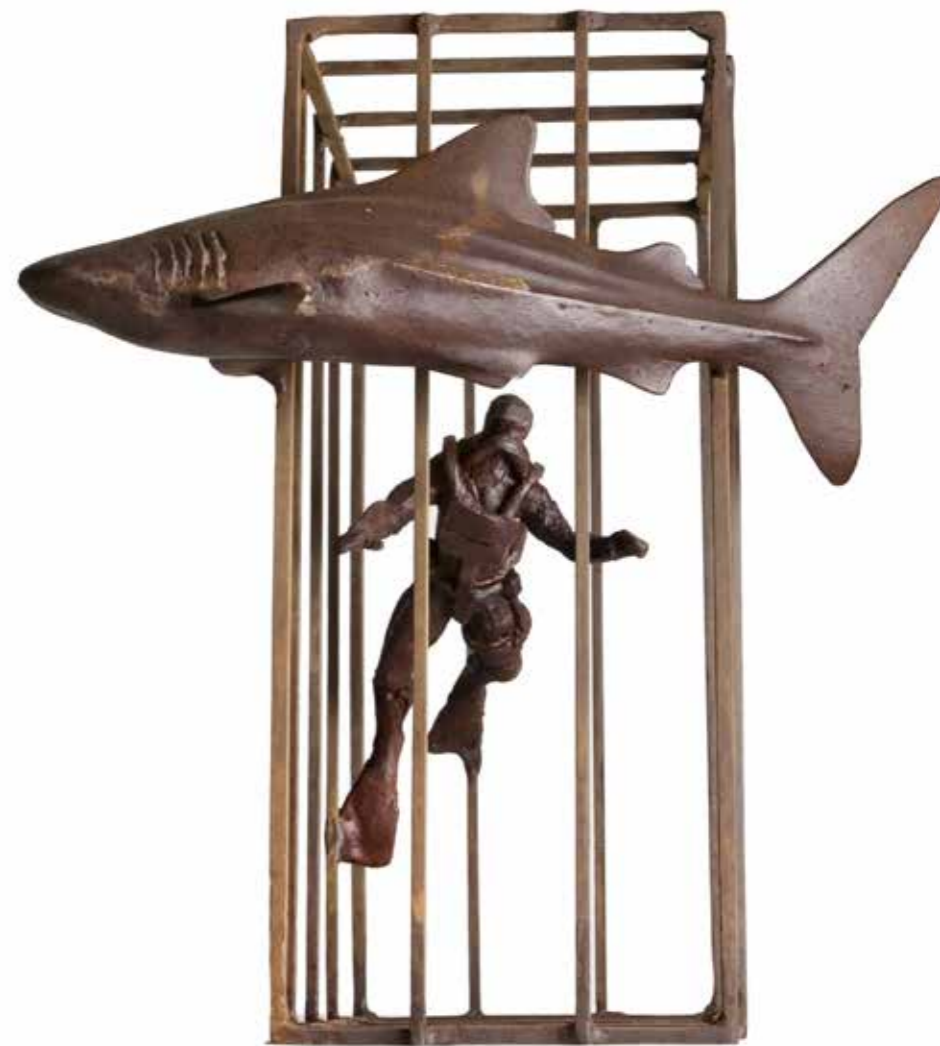
Dentro-Fuera ED. 5/15 Bronze and iron.