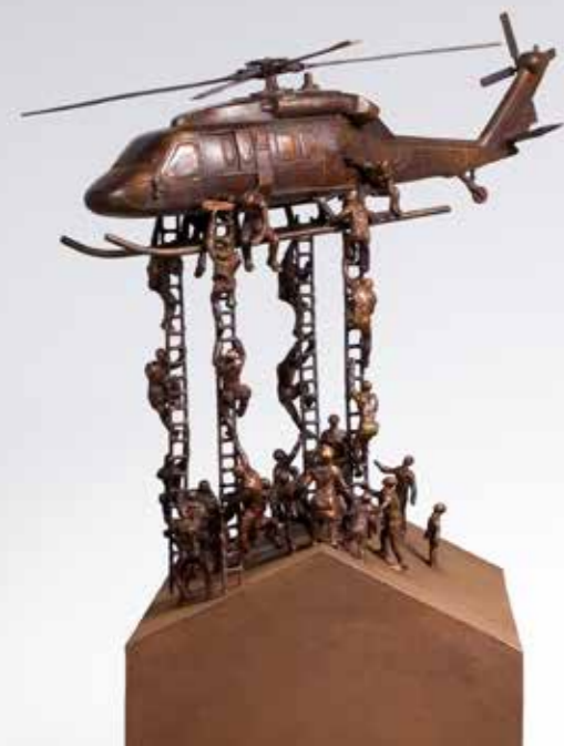
Cambio Climatico Unique piece Bronze, Iron.