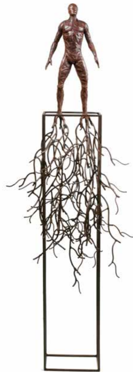
Hombre Raices Ed. 4/7 Bronze, Iron.