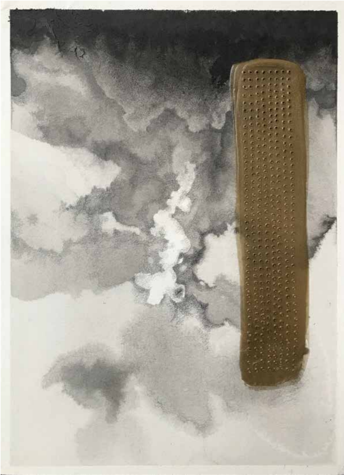
Agitation Alignée V

Indian ink, beeswax and gold powder on paper.