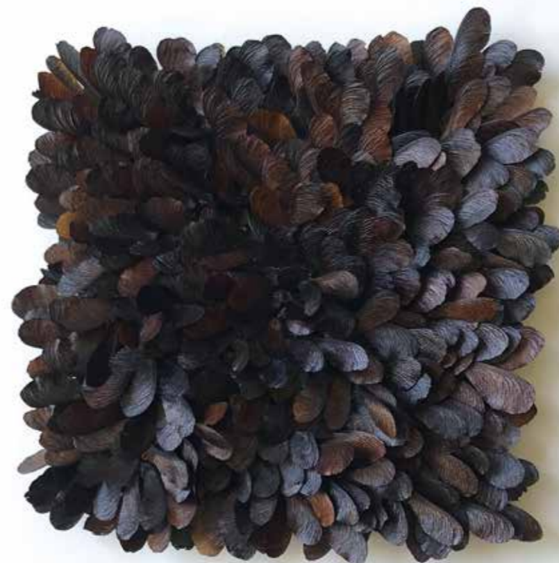
Relique Carbonisée II