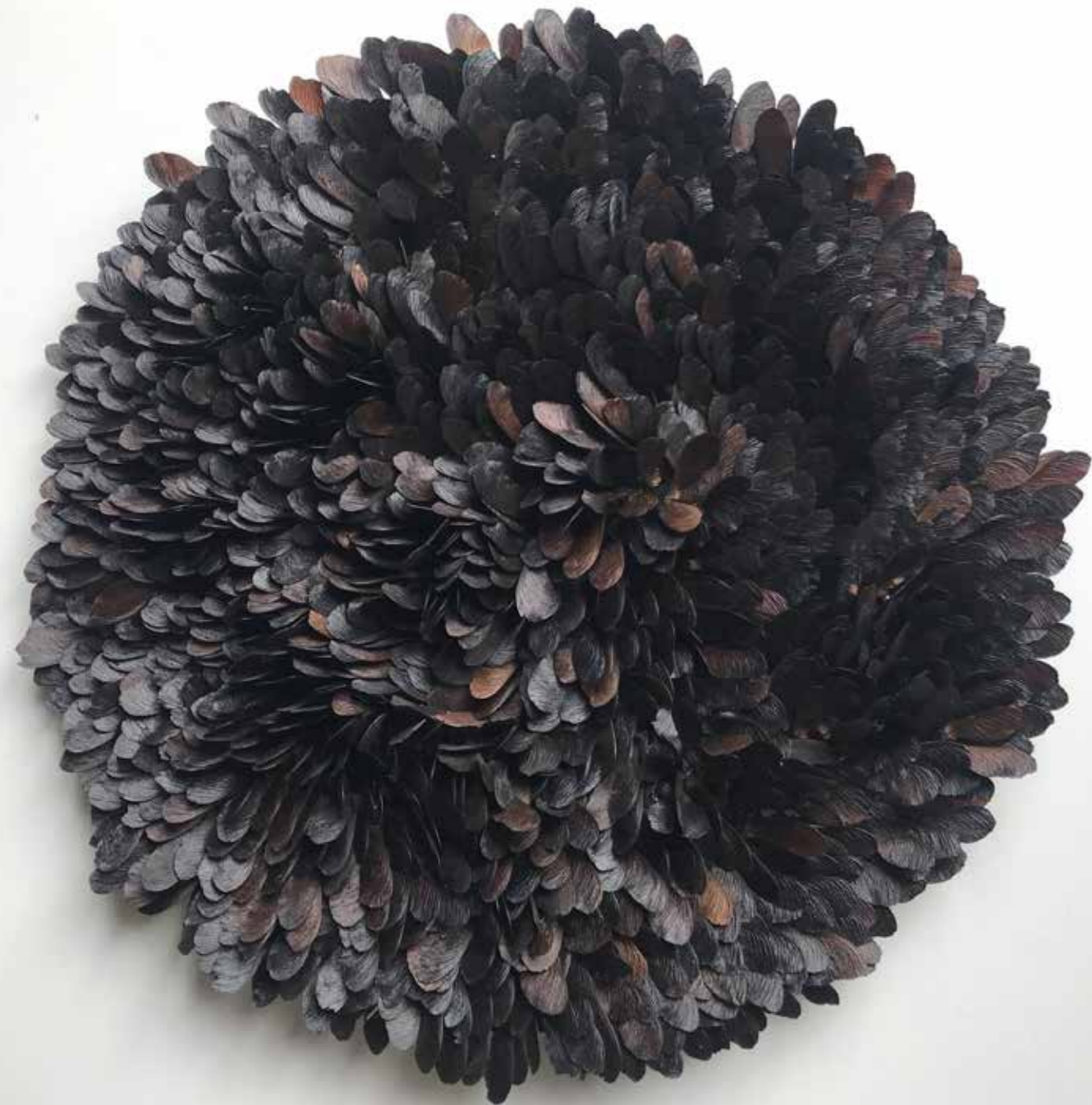
Relique Carbonisée VIII