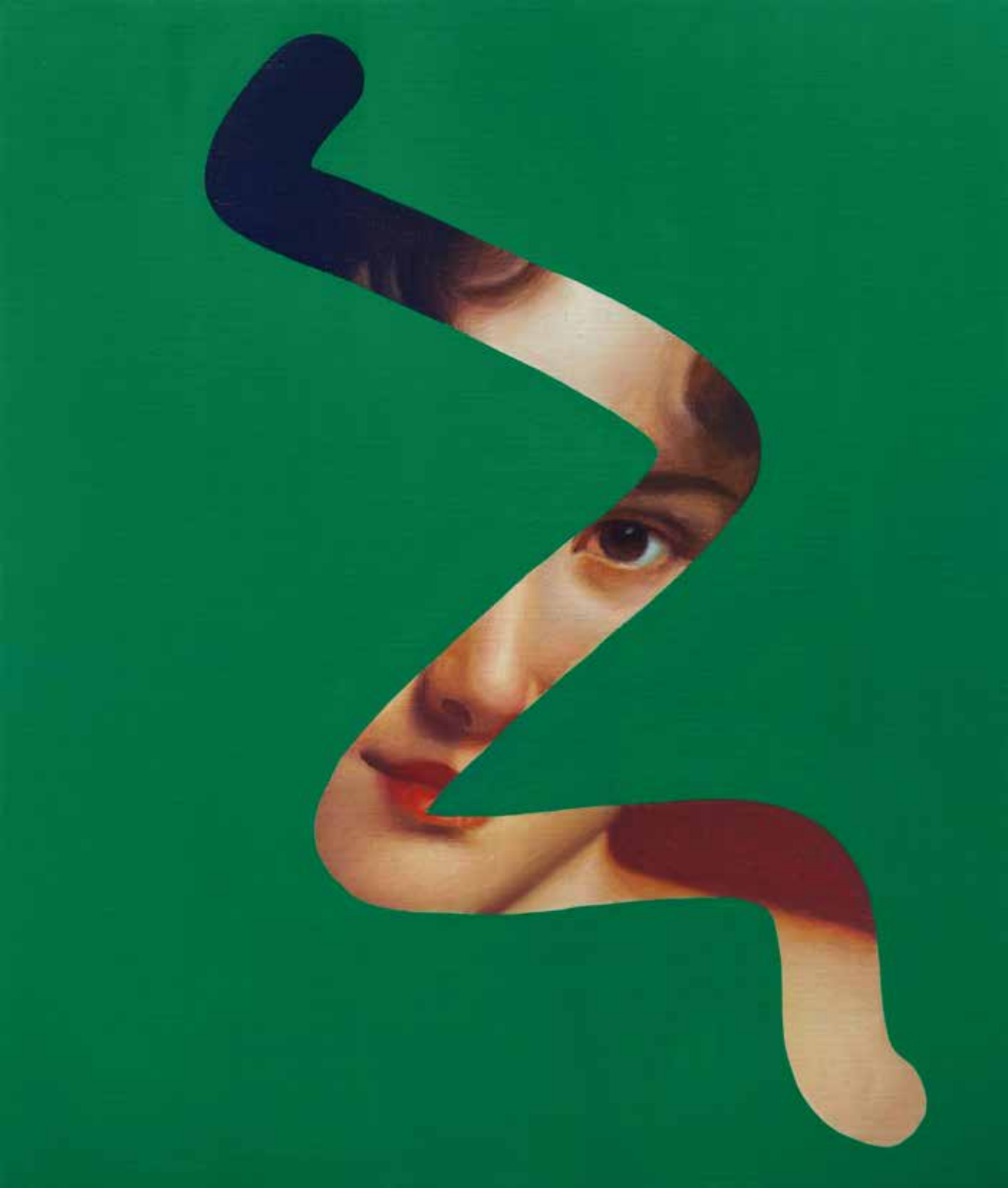
Fake Abstract Green on François Gérard - 2022 H 65 x 55 cm.