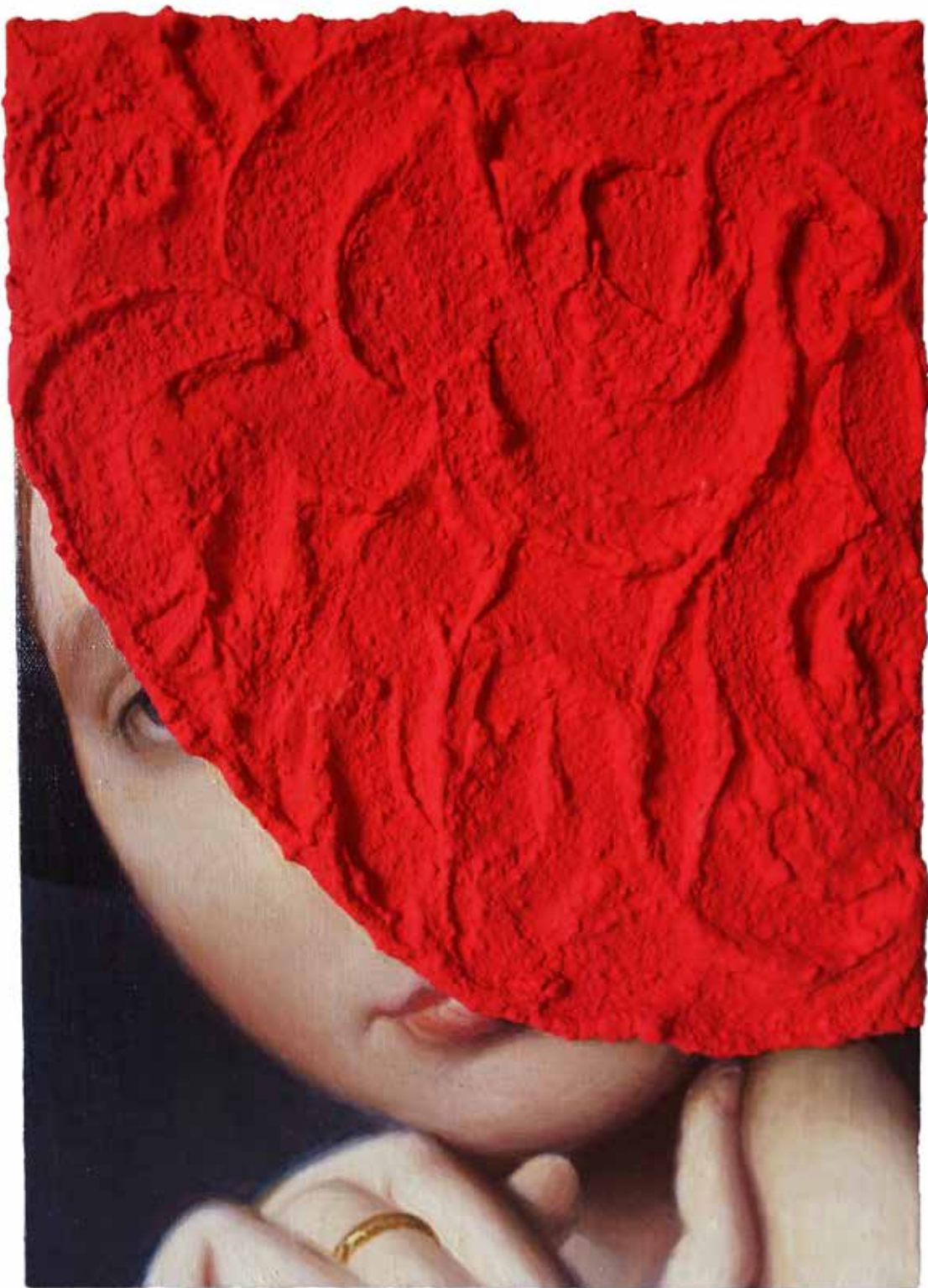
Concrete Red H 40 x 30 cm