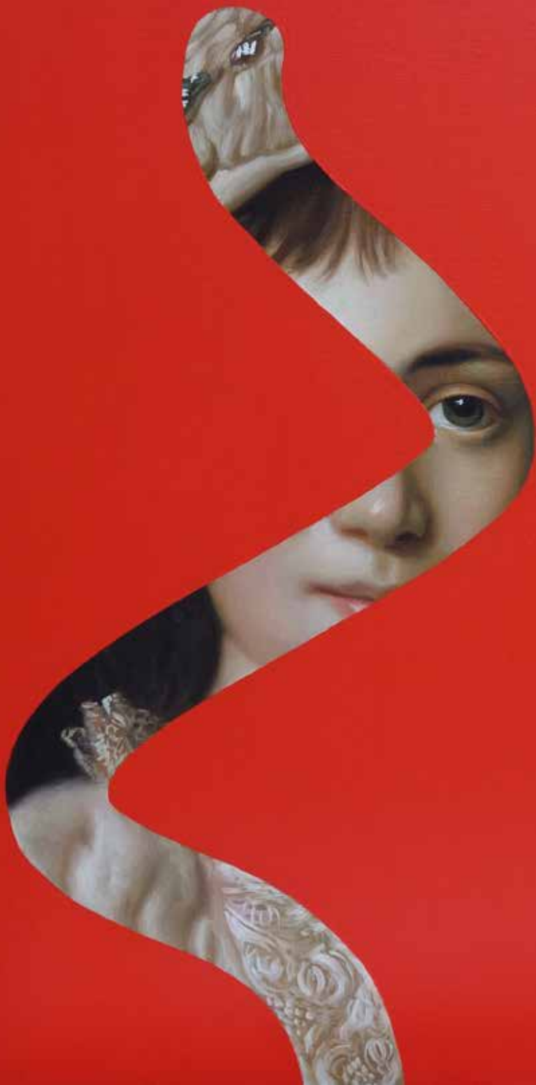
Fake Abstract Red on A. Roslin - 2022 H 70 x 60 cm.