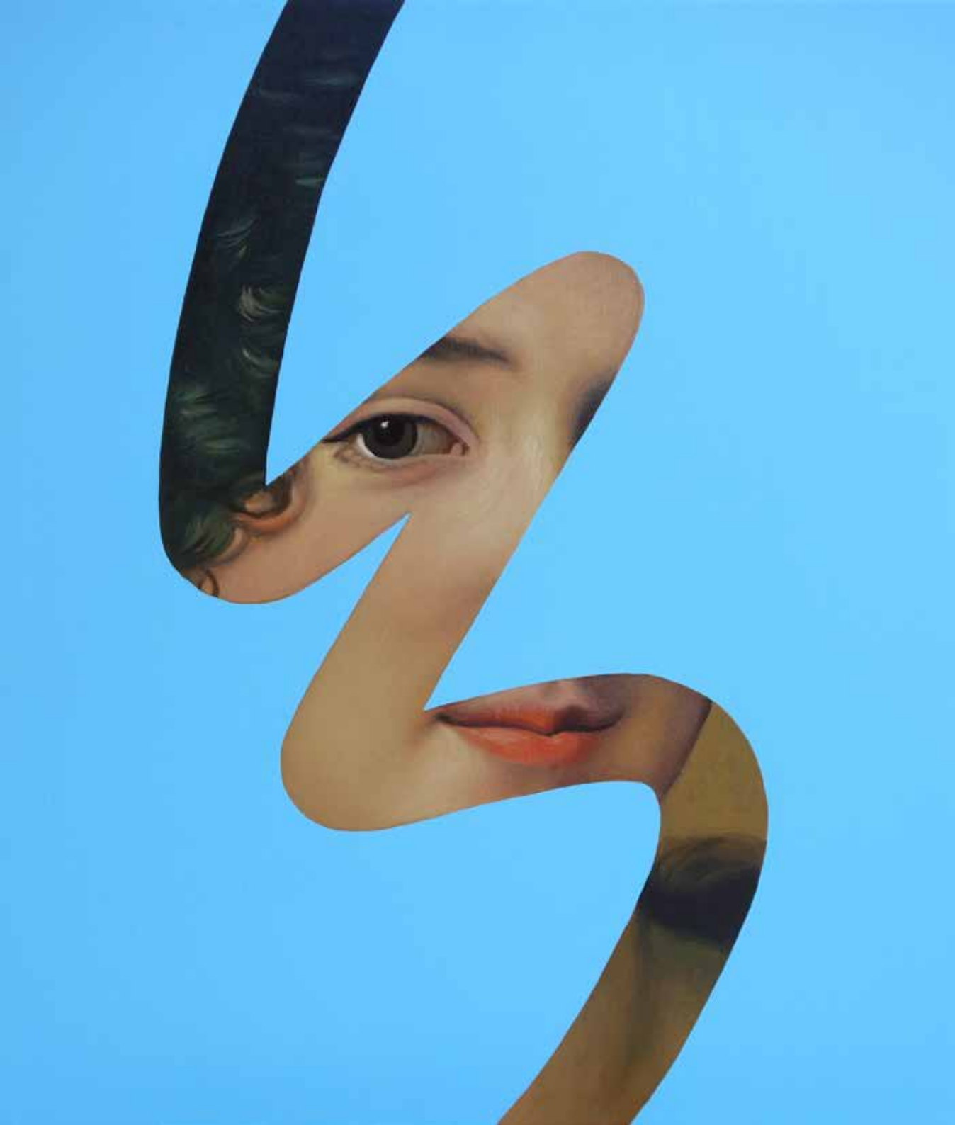
Fake Abstract Blue on J.F. Voet - 2022 H 65 x 55 cm.