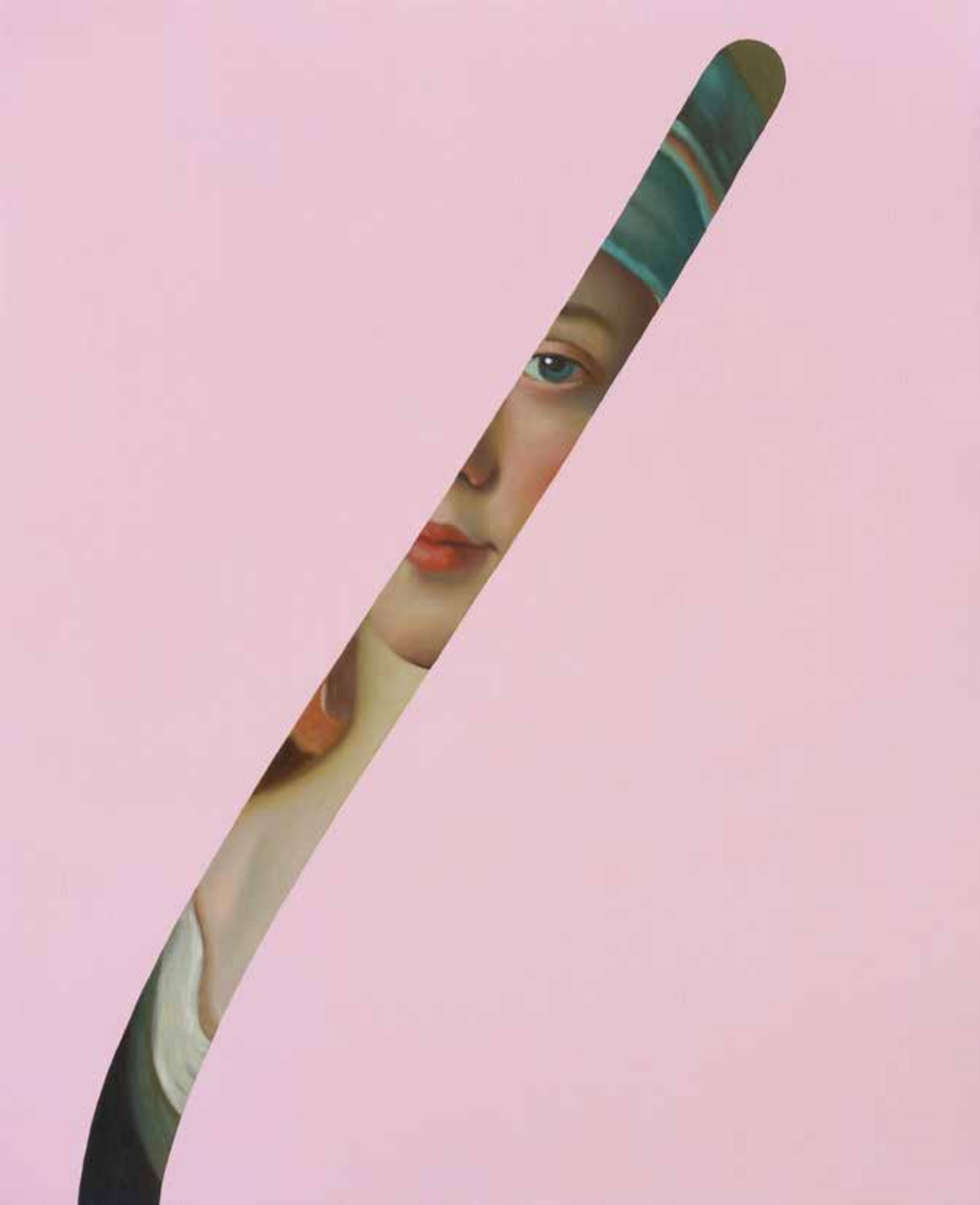
Fake Abstract Pink on P.A Rotari- 2022 H 100 x 82 cm.