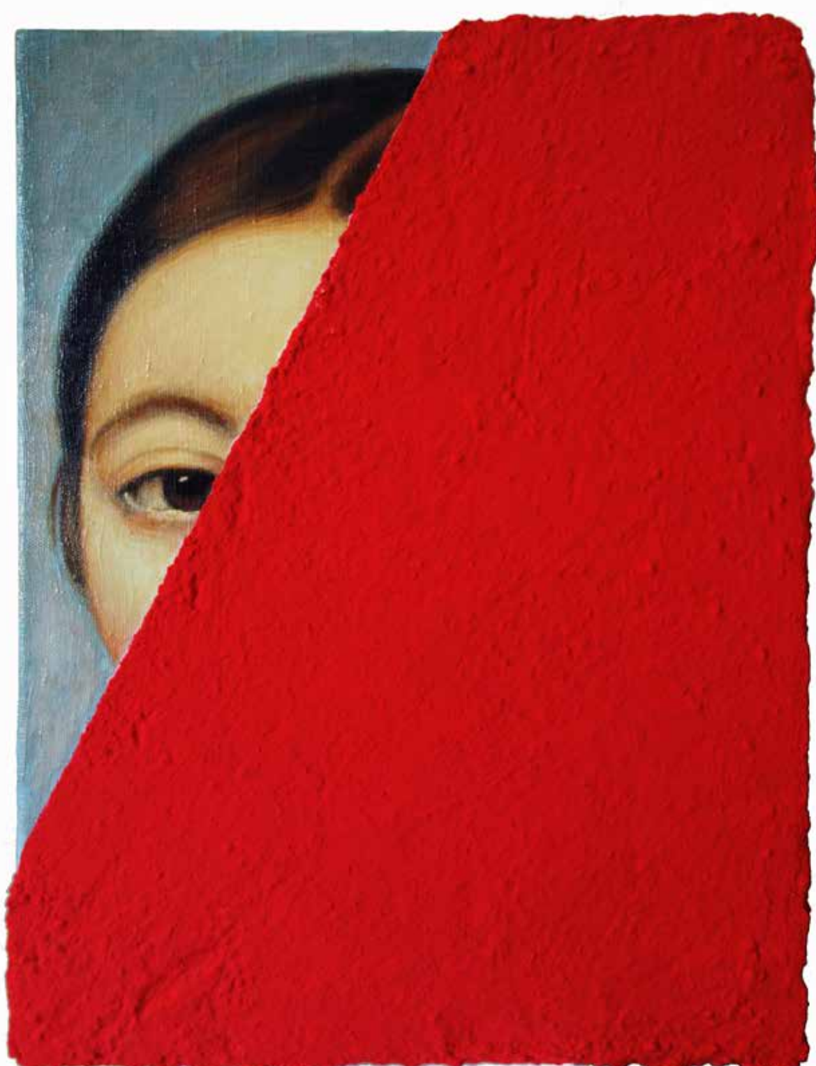
Concrete Red II H 40 x 30 cm