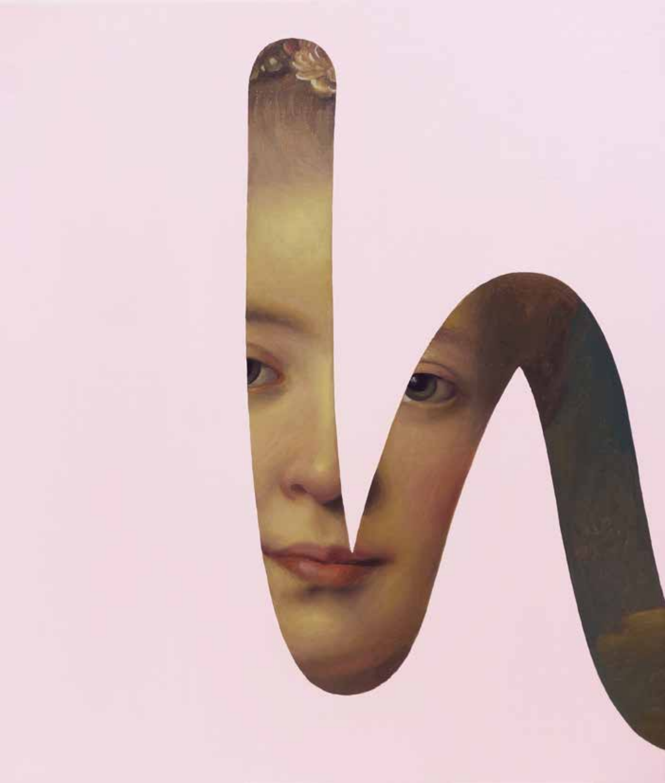
Fake Abstract Pink on Nattier - 2022 H 65 x 55 cm.