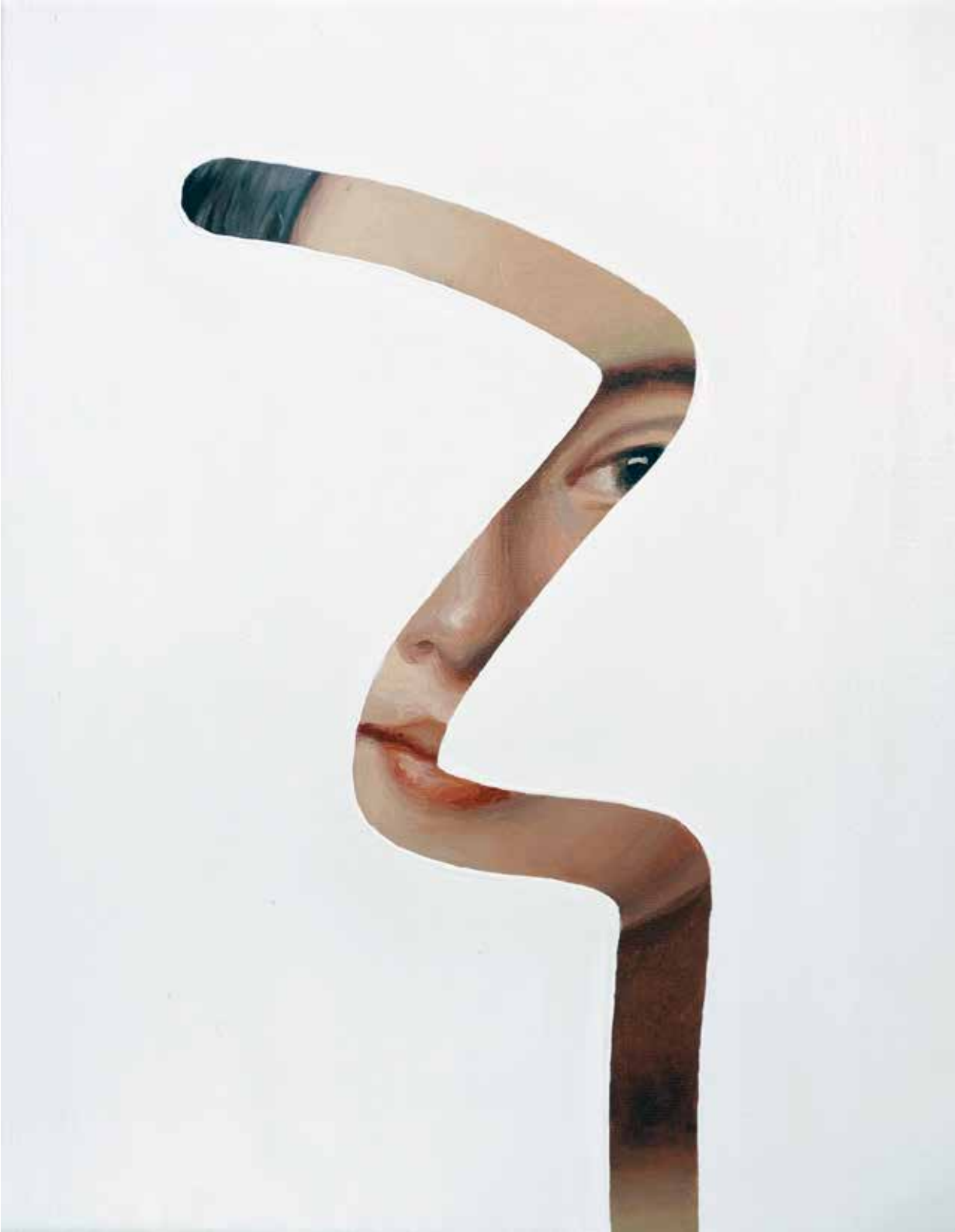
Fake Abstract White on Madrazo H 35 x 27 cm