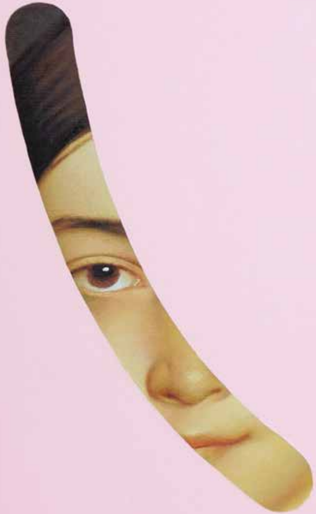
Fake Abstract Pink on Ingres - 2022 H 70 x 60 cm.