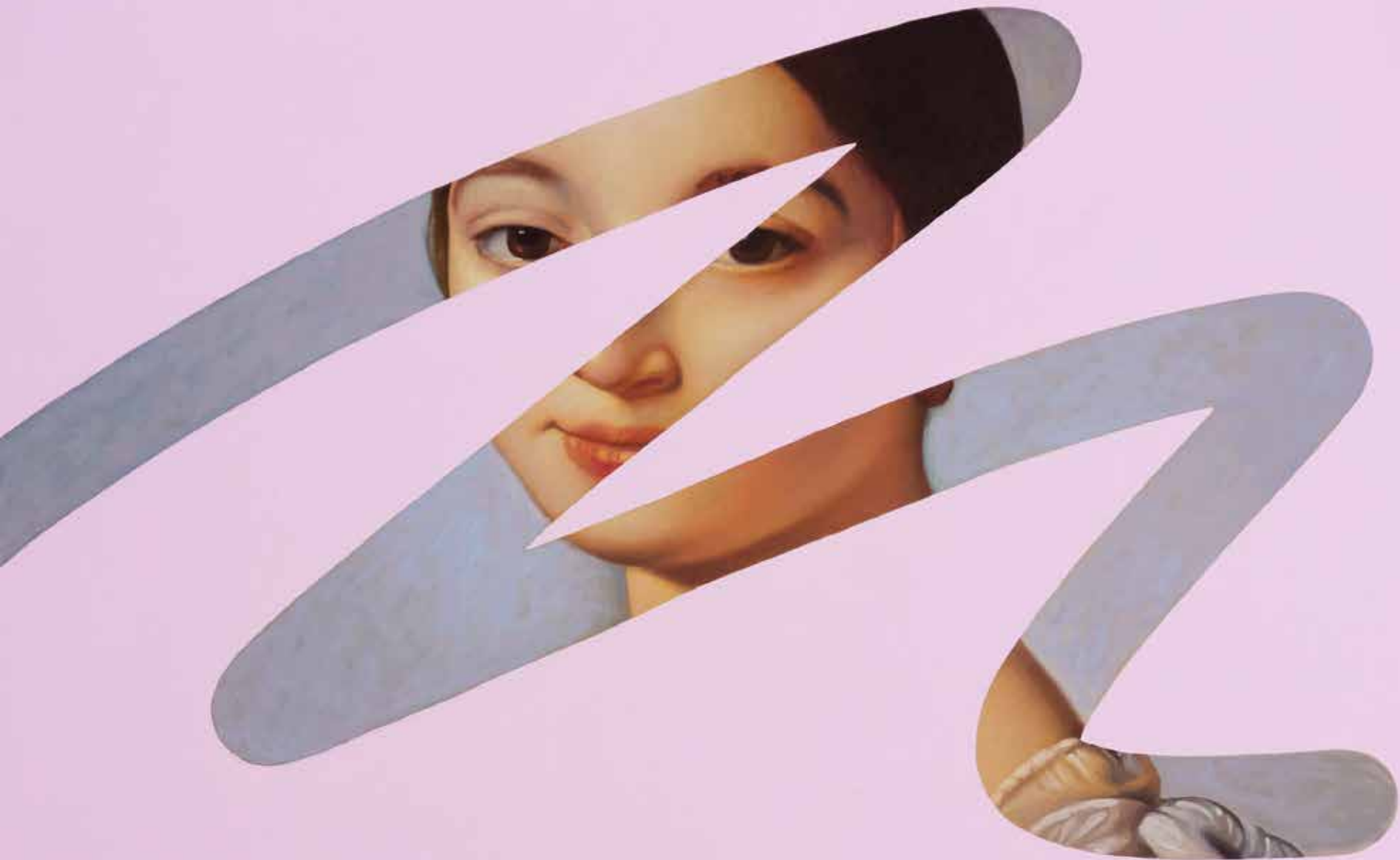
Fake Abstract Pink on Ingres - 2022 H 82 x 100 cm.