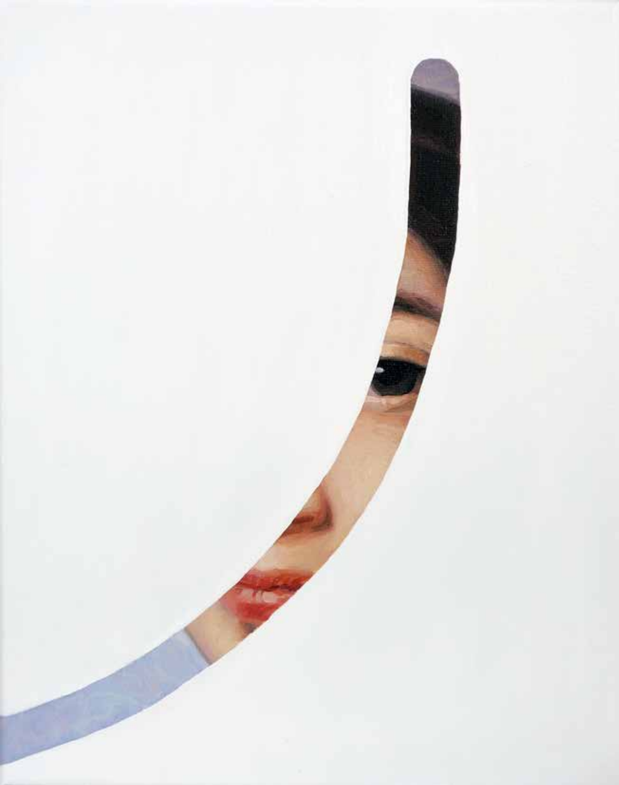
Fake Abstract White on Ingres H 35 x 27 cm