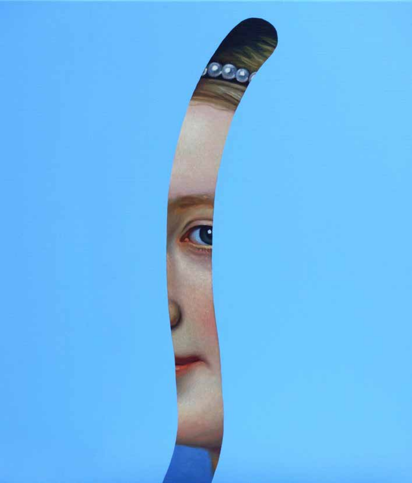
Fake Abstract Blue on Stieler - 2022 H 70 x 60 cm.