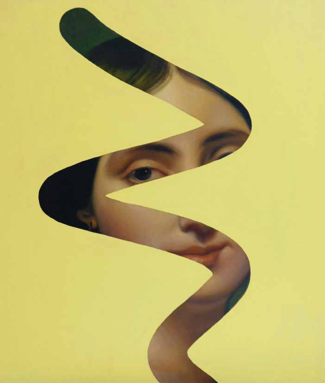
Fake Abstract Yellow on Ingres- 2022 H 65 x 55 cm.