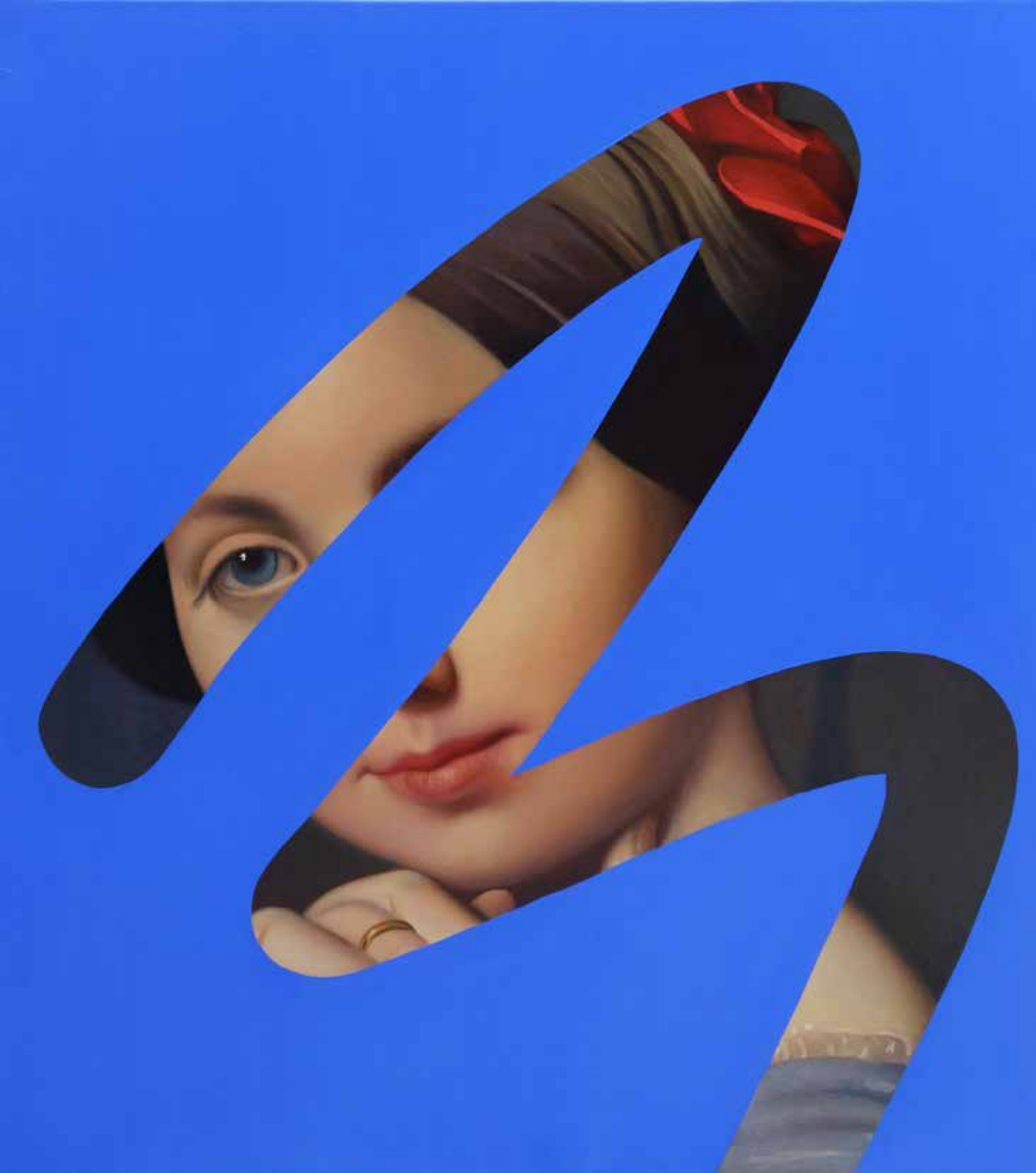
Fake Abstract Blue on Ingres - 2022 H 150 x 128 cm.