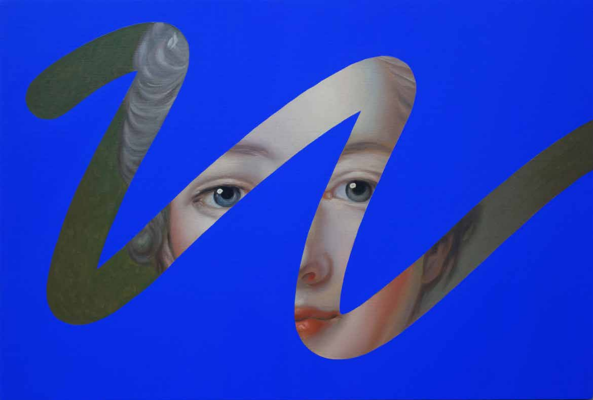
Fake Abstract Blue on F. Boucher 2020 - H 64 x 94 cm.