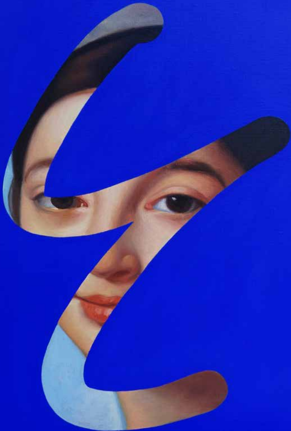
Fake Abstract Blue on Ingres - 2022 H 70 x 60 cm.