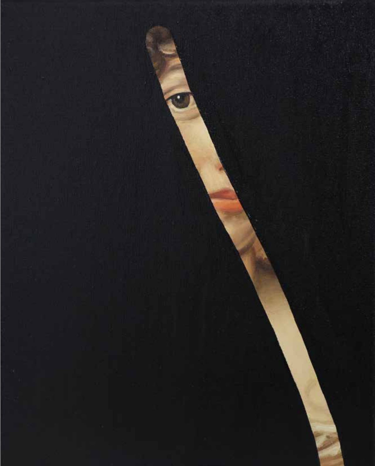
Fake Abstract Black on Jacob F. Voet H 35 x 27 cm