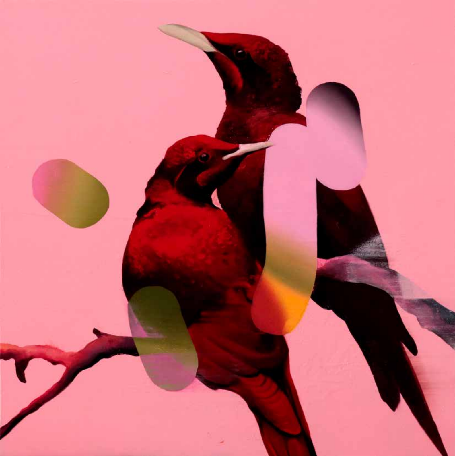
Starlings (Red) (2021)